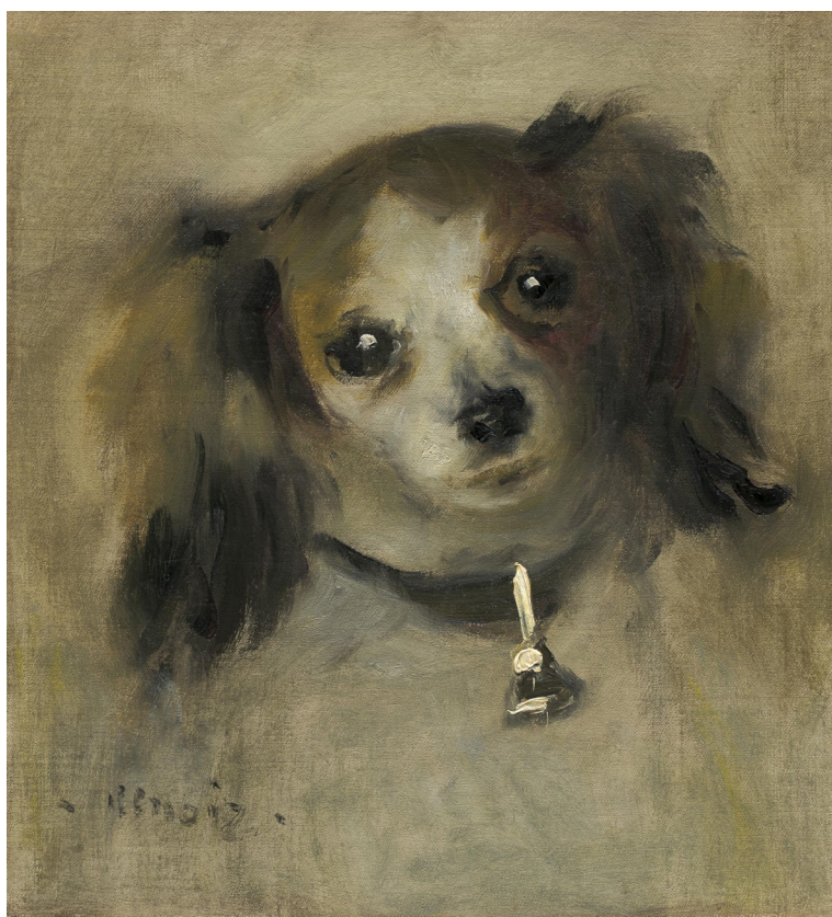
Pierre-Auguste Renoir, Tête de chien (1870)