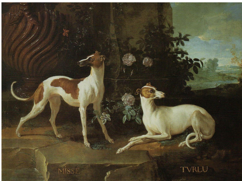
Jean-Baptiste Oudry, Misse et Turlu, les levrettes de Louis XV (1725)