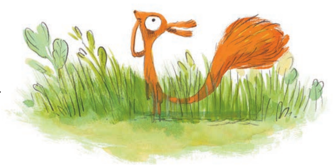
© Illustrations de Clotilde Perrin et Olivier Tallec

Les établissements situés hors de la France hexagonale peuvent participer où qu'ils se trouvent dans le monde. S'ils gagnent, la rencontre avec l'auteur se fera en visioconférence.