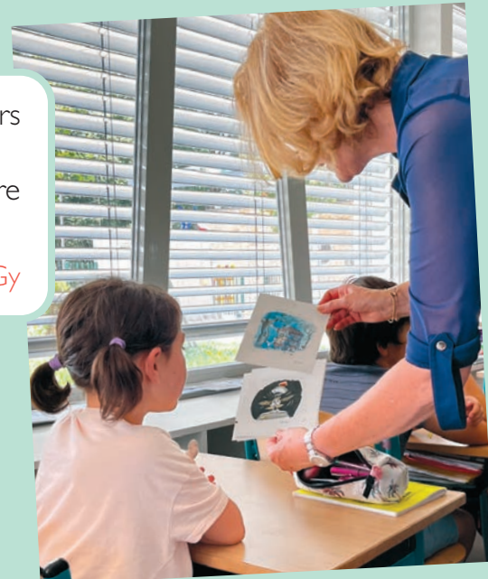
© Illustrations de Beatrice Alemagna et Magali Bardos

« Merci à vous!! Les enfants sont fiers et contents de votre visite!! Un moment qu'ils garderont en mémoire longtemps! » Mme Daval, école Catherine Fraischot à Gy