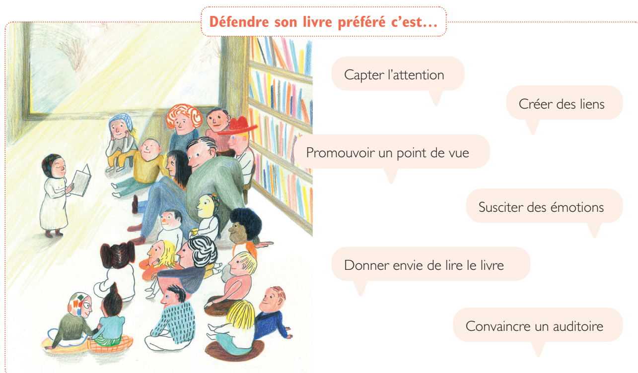
Illustration : Mère méduse, Kitty Crowther, l'école des loisirs, 2014.